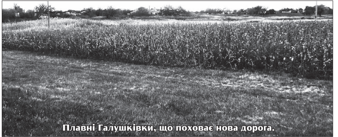
Плавні Галушківки, що поховане нова дорога.

інтенсивність руху автомобільного транспорту стала такою, що існуючі можливості двосмугового шляху з поворотами інколи до 90 градусів, з будинками місцевих жителів усього за 5 – 10 метрів від траси уже давно не відповідають його запитам. Не позаздриш і мешканцям згаданих сіл - неймовірно зрештум двигунів великотоннажних фур, збільшилося число ДТП, є випадки розтріскування прилеглих будинків жителів, в спеку колії шляху просто продавлюються і т. п. Ось що про будівництво нової траси читачам «Фермера Придніпров'я» розповідає в. о. начальника Служби автомобільних доріг в Дніпропетровській області Геннадій Немога: