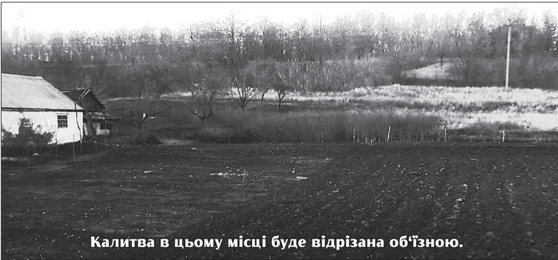
Калитва в цьому місці буде відрізана об'їзною.

Калитва, краще добре подумати й зупинитися вже сьогодні? І почати стелити дорогу по давно наміченій пращурми лінії Чумацького шляху, присипана сіль з возів якого і сьогодні прикрашає небосхил над Україною? Вже самою своєю назвою він би неабияк привабив майбутніх інвесторів, туристів до краю! Коли бодай це зрозуміємо?